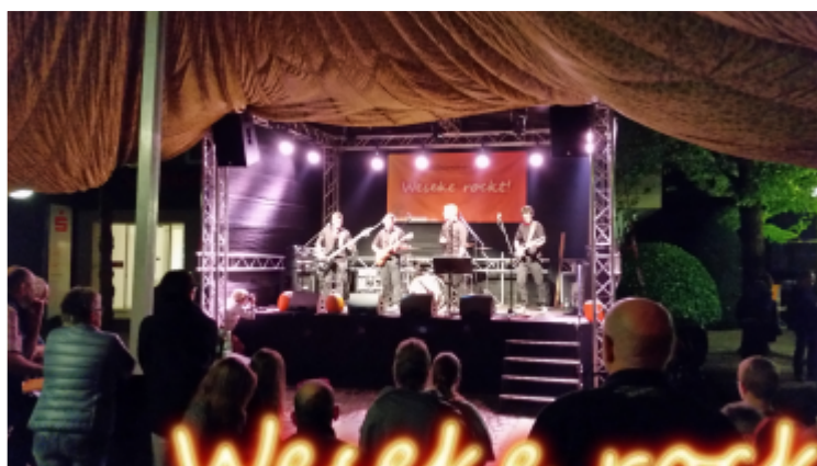
Foto links: No one left - die jungen Musiker gaben sich routiniert und brachten das Publikum sogar zum Schunkeln.

Am Samstag vor dem Sippelmarkt fand in diesem Jahr erstmalig der FUN-Samstag statt. Ab ca. 15 Uhr ging es los mit Weseke kickt - dem Menschenkicker-Turnier ! Gespielt wurde die Turnierart "Jeder gegen jeden": In 21 Spielen traten 7 Teams gegeneinander an. Alle Beteiligten zeigten ca. 4,5 Std. vollen Körpereinsatz und hatten dabei eine Mordsgaudi ! Nachdem um ca. 19:45 Uhr dann endlich der Turniersieger "FC Willingen" feststand, ging es direkt nebenan auf der Bühne weiter mit dem Live-