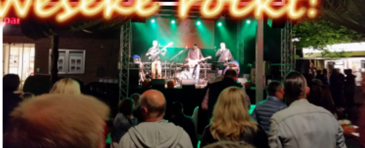
Foto rechts: Die Muddy Frogs überzeugten mit feinstem Blues-Rock.