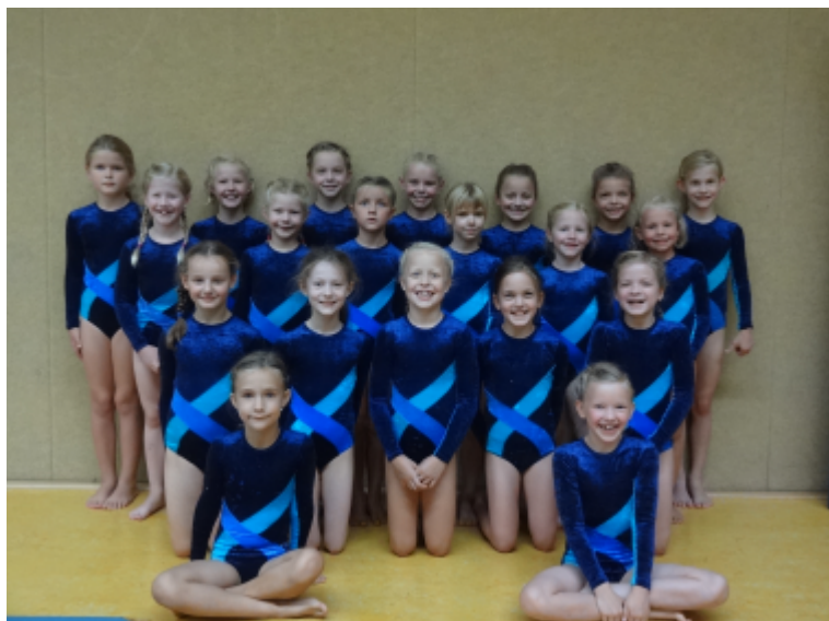
Foto: Weseker Turnerinnen der Jahrgänge 2007-2011, die am Bezirksturnfest teilgenommen haben

37 Mädchen vom SV Adler Weseke turnten beim Bezirksturnfest mit insgesamt 200 anderen Kindern am Sprung, Reck, Balken und Boden ihre Übungen.