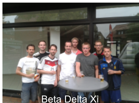
Beta Delta Xi