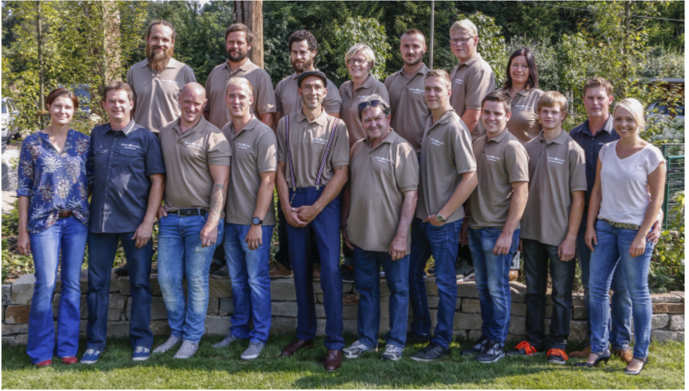
Foto: Die Belegschaft der Büning und Beuting Galabau GmbH

Büning und Beuting feierte runden Geburtstag