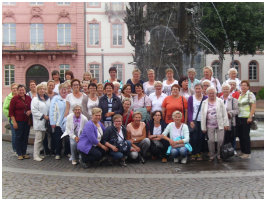
Foto: Die kfd-Damen vor dem Fastnachtsbrunnen in Mainz

Zwei vergnügliche Tage haben die Damen der kfd Weseke am 03. und 04. September in Ingelheim und Mainz verbracht.