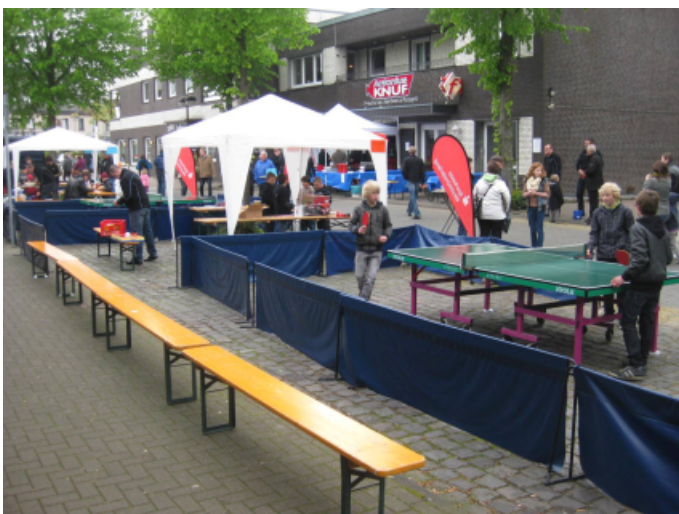
TTV-Stand, Weseker Frühling 2013

Bereits zum 4. Mal in den letzten 10 Jahren, lädt der Tischtennisverein Weseke nun wieder alle Besucher des Weseker Frühlings zu dem einen oder anderen Match ein.