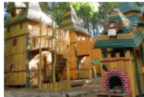
Tiere im Park