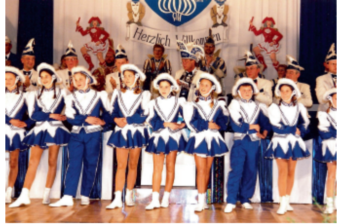
Foto: 2001 - T-WRZ - Blue Diamonds

Das soll es an dieser Stelle gewesen sein. Dieser Rückblick in die Vergangenheit hat keinen Anspruch auf Vollständigkeit. Auch gibt es immer sehr individuelle Aspekte und Sichtweisen, wenn man auf die Geschichte des WRZ zurückschaut. Diesen allen gerecht zu werden, würde den Rahmen unserer Möglichkeiten sprengen.