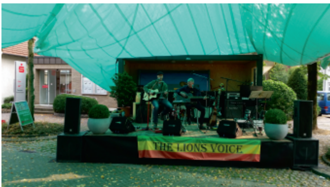
Foto: "Saitensprung" interpretierte meisterhaft bekannte Klassiker

Am 20.09. veranstaltete der WUK erfolgreich den zweiten Sippelmarkt mit dem neuen Konzept im Weseker Ortskern. Das Organisationsteam hatte sich auch dieses mal wieder einiges einfallen lassen, um möglichst viele Besucher in die Einkaufsstraßen rund um die Kirche zu locken. Neben ca. 30 verschiedenen Ständen auf der Hauptstr. und auf dem Schlückersring, gab es wieder ein abwechslungsreiches und interessantes Programm aus Musik und Tanz auf der Showbühne.