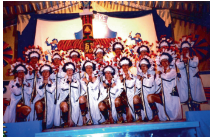
Foto: 1998 - Showtanzgruppe Adler Weseke