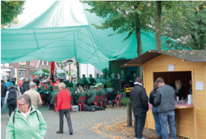
Foto: Der Musikverein Weseke begeisterte die Zuhörer mit seinem Repertoire