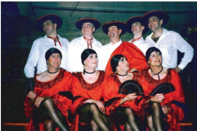
Foto: 1997 - Männerballett Zwiebelfeger

Knapp 20 Besucher kamen zur ersten Prinzenproklamation 1990 in die Gaststätte Becker. Doppelt so viele waren es 1991 in der Gaststätte Niehoff. 120 Personen waren es 1992 im völlig überfüllten alten Pfarrheim. Zweimal über 400 Personen waren es 1993 und 1994 in der Roncalli-Turnhalle. Seit 1995 feiern wir in einem extra dafür aufgestellten, beheizten Festzelt auf dem Festplatz und können bis zu 800 Plätze anbieten. Im Oktober 1995 wurde unsere Prinzenzwiebel gut sichtbar im Kreuzungsbereich Hauptstraße/ Schlückersring/ Südlohner Str./ Klünstraße aufgestellt. Jeweils für den Rosenmontagszug wird sie demontiert und auf den Prinzenwagen gestellt, hier dient sie dann als Repräsentation unseres Prinzenpaares während des Umzuges.