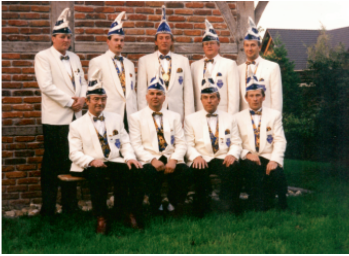
Foto: WRZ-Vorstand 1995