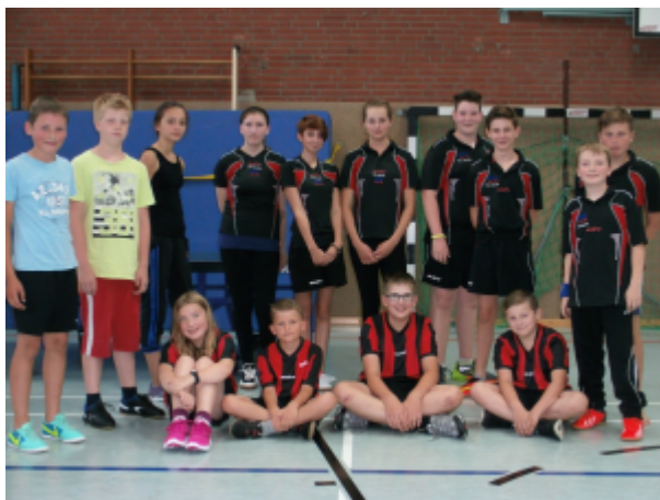
Foto: Einige Spieler des Schüler- und Jugendbereiches