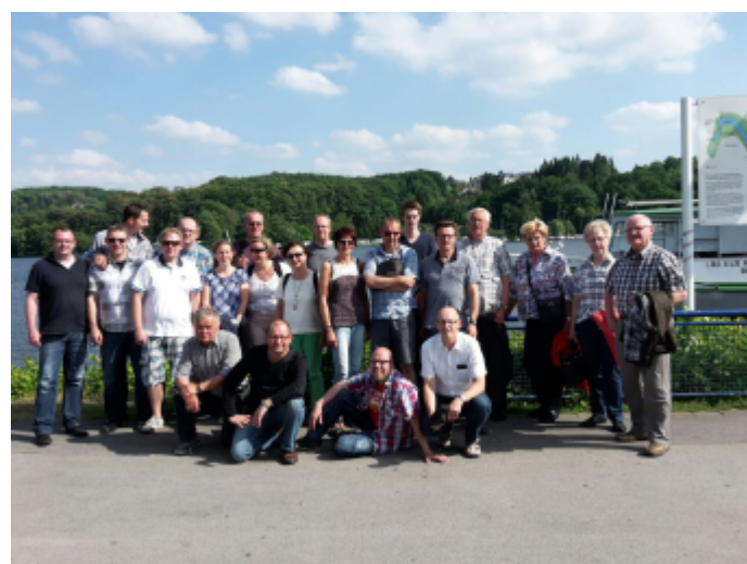
Foto: Der TTV Weseke auf Vereinsfahrt am Baldeneysee

Am letzten Juli-Wochenende starteten die Erwachsenen aktiven und passiven Weseker Tischtennispieler mit dem Bus in Richtung Essen/Baldeneysee. Neben eines Spaziergangs rund um die Villa Hügel durfte natürlich die Schifffahrt mit der weißen Flotte genauso wenig fehlen wie lecker essen, trinken und Gute Laune. Zurück in Weseke, wurde in der „Zwiebel“ bis in den späten Abend gefeiert.