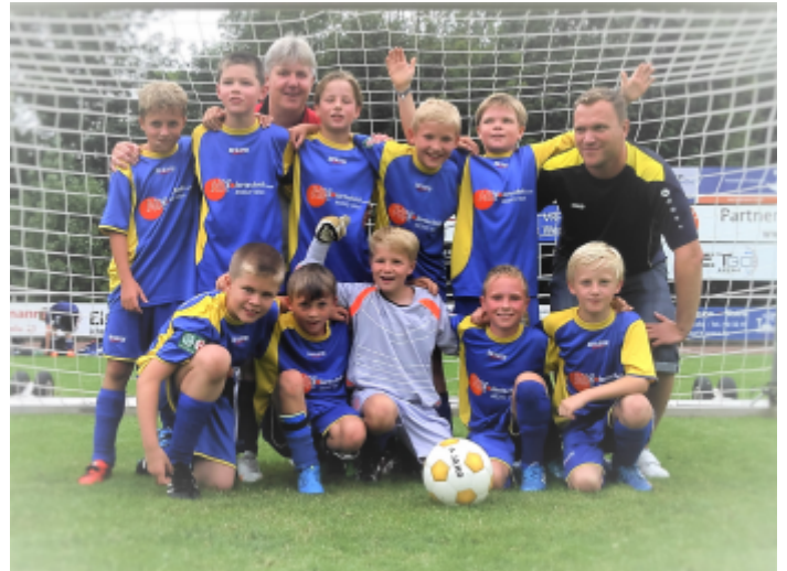
Foto: Stadtmeister E1 Jugend des SV Adler Weseke

Bei den Stadtmeisterschaften am letzten Wochenende konnten die 1er Mannschaften ihre sehr gute Frühform mit einem vierten, einem dritten und zwei zweiten Plätzen schon unter Beweis stellen. Als Highlight errang die E1 den Stadtmeistertitel. Auch unsere Jugendabteilung bleibt vom demographischen Wandel leider nicht verschont. Schon in den vergangenen Jahren haben wir deshalb mit unserem Nachbarverein FC Oeding für die Mädchenmannschaften eine Jugendsportgemeinschaft gebildet.