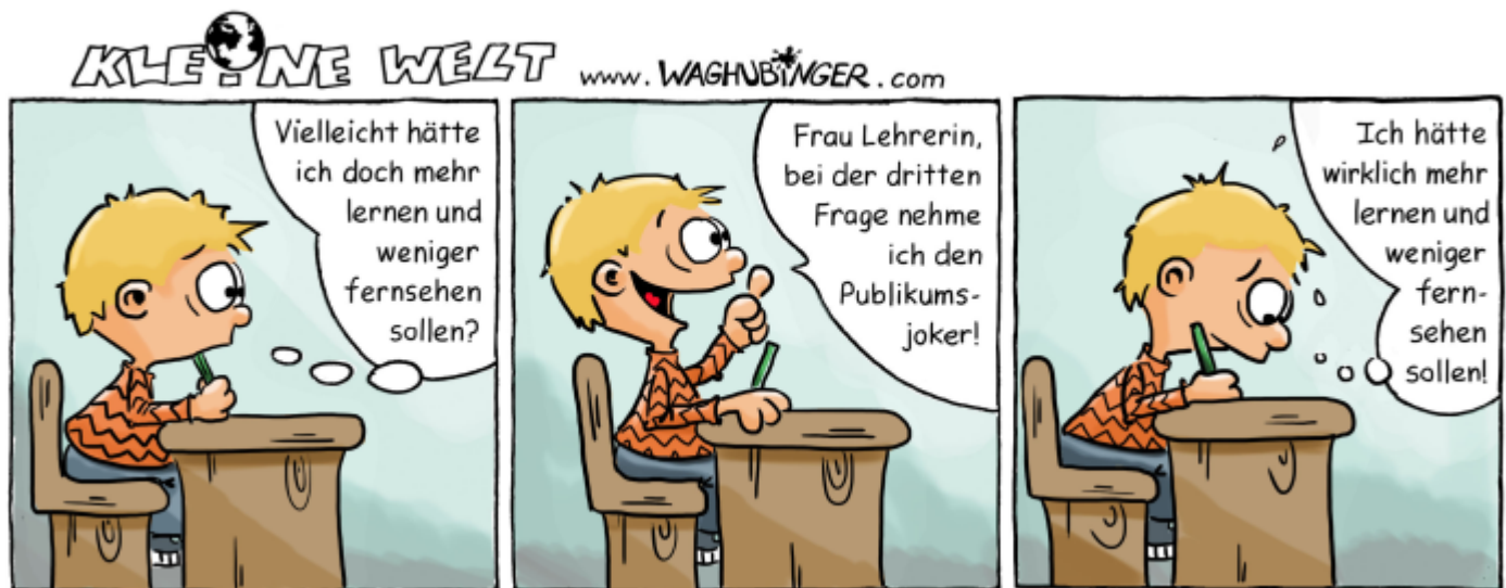
Lösung des Sudokus