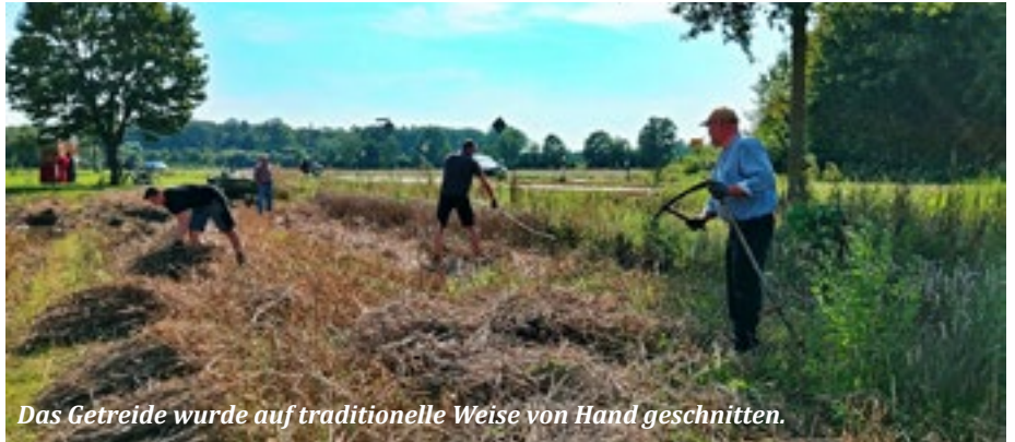
Das Getreide wurde auf traditionelle Weise von Hand geschnitten.