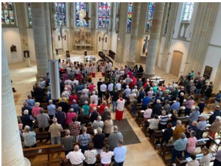
Das Pfarrfest begann mit einem sehr gut besuchten Gottesdienst.

„Es war ein toller Auftakt nach den Sommerferien. So macht es Spaß zu musizieren. Wenn die Freude und Begeisterung für die Sache bei den Musikern und den Organisatoren zu spüren ist und auf die Besucher überspringt, dann hat man doch alles erreicht. Wir freuen uns auf die nächste Einladung.“