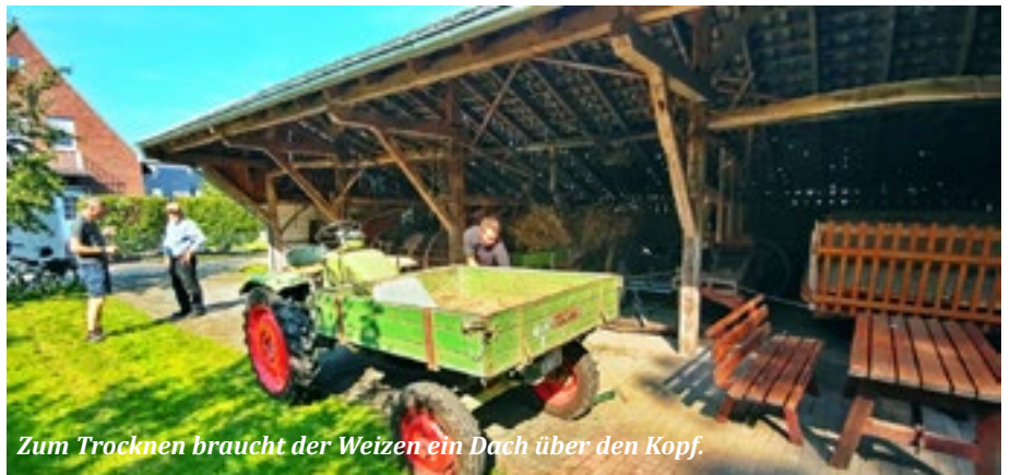
Zum Trocknen braucht der Weizen ein Dach über den Kopf.