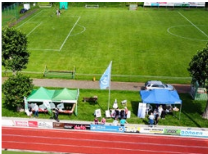
Perfekte Bedingungen im Adler-Sportpark

Spätdienst ging zur Arbeit. Für das leibliche Wohl war gesorgt: nichtalkoholische Getränke und Würstchen im Brötchen – auch vegetarische – waren kostenlos erhältlich.