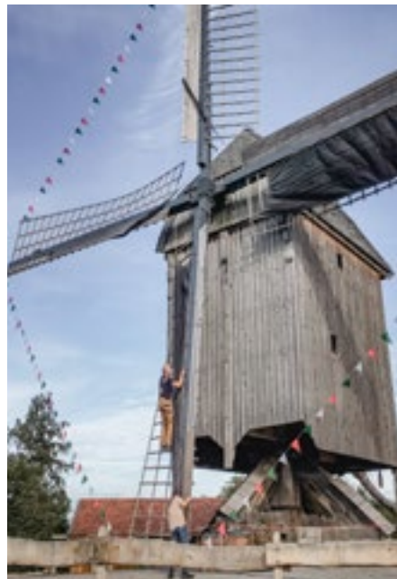
Die Mühlenfeste sind stets gut besucht. Die Bockwindmühle wird dafür festlich geschmückt.