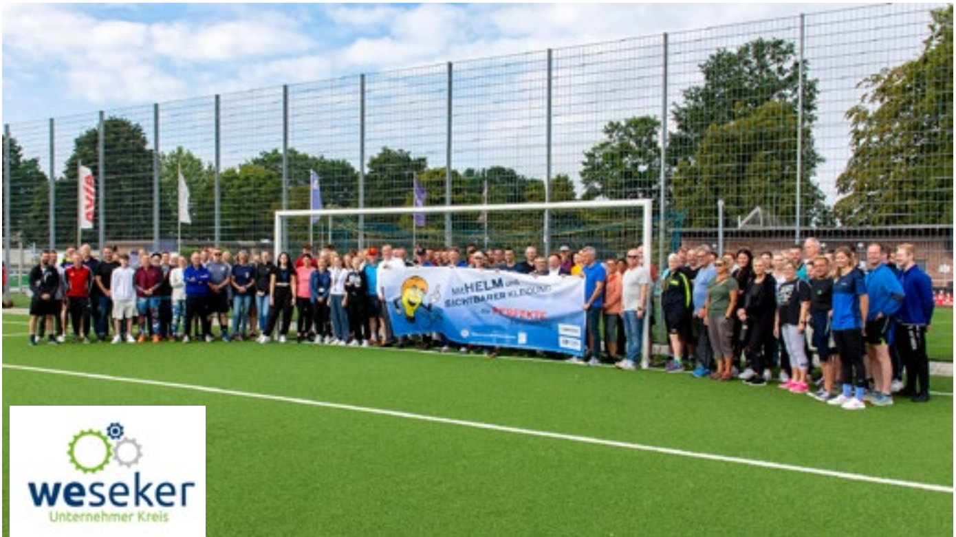
Derzeit besteht in Deutschland keine gesetzliche Helmpflicht für Radfahrende. Deshalb appelliert die Polizei im Kreis Borken mit Werbebannern an die Vernunft. In Anwesenheit des Landrats Dr. Kai Zwicker wurde das vom Weseker Unternehmerkreis gesponserte Banner zunächst für ein Pressefoto entrollt und später im Eingangsbereich zum Adler-Sportpark platziert.

günstigsten Modelle starten bei 30 Euro. Wer will, kann aber auch bis zu 200 Euro für seinen Kopfschutz ausgeben. Eine Anprobe in einem Fachgeschäft ist sinnvoll. Gerade in den dunkleren Jahreszeiten und den späten Abendstunden hängt die Sicherheit im Verkehr auch von einer gut sichtbaren Kleidung der Verkehrsteilnehmer ab. Hierbei kann zum Beispiel auf Reflektoren oder preisgünstige Warnwesten zurückgegriffen werden, die durch ihre leuchtenden Farben sofort ins Auge stechen. Denn nur, wenn Autofahrer Radfahrer frühzeitig entdecken, können sie einen schweren Unfall verhindern.