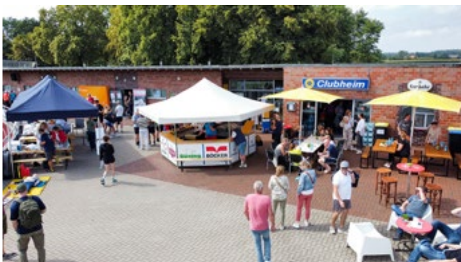
Es herrschte ein reges Kommen und Gehen.

Diejenigen Polizeibeamten, die ihrer Verpflichtung zum Ablegen des Sportabzeichens noch nicht nachgekommen waren, konnten Leistungen im Weitsprung, Schleuderballwurf, Medizinballwurf, Sprintdisziplinen, Seilspringen und Kugelstoßen erfüllen. Hoch im Kurs stand der 3000m Lauf auf der modernen Tartanbahn.