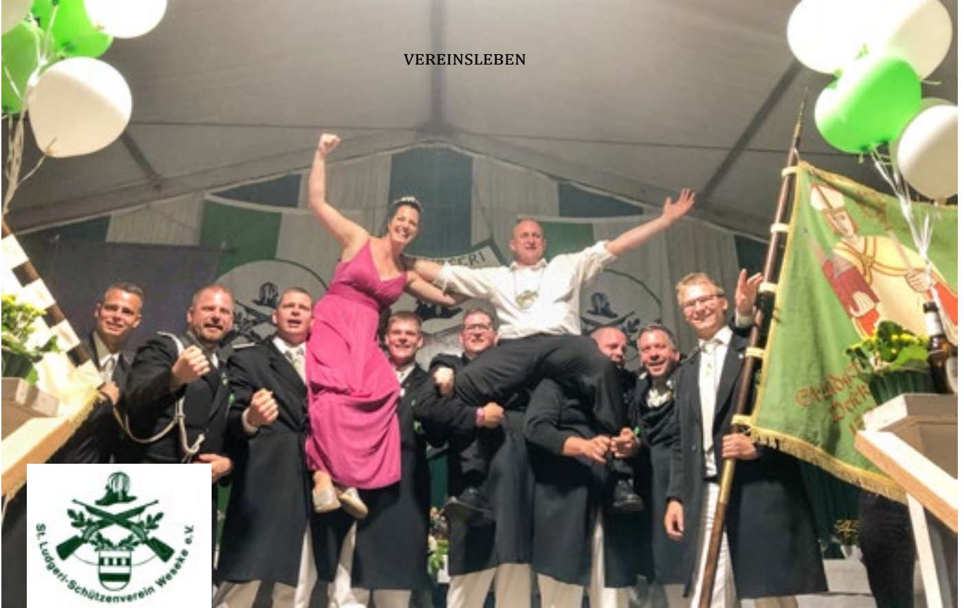
Freude auf allen Seiten: Auch die Offizierskollegen bejubeln ihr neues Königspaar.