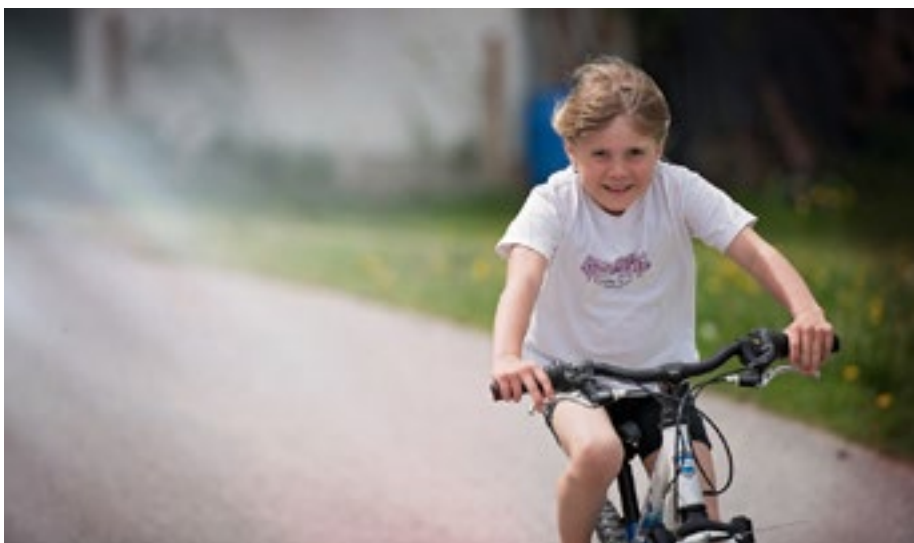
Besser nicht: Ohne Helm fahren Kinder mit hohem Risiko.

Sicherheit ist das Allerwichtigste im Straßenverkehr. Es wird immer wieder festgestellt, dass Radfahrende ohne reflektierende Kleidung unterwegs und daher für andere Verkehrsteilnehmer schlecht sichtbar sind, so das Ministerium für Verkehr in Nordrhein-Westfalen. Auch der Fahrradhelm gehört für viele ebenfalls noch nicht zur Standardausrüstung. Bei den Verkehrsunfällen mit Personenschaden unter Beteiligung von Pedelec-fahrenden sind NRW-weit deutliche Steigerungen zu verzeichnen. Im vergangenen Jahr sind allein im Kreis Borken 762 Rad- und Pedelec-fahrende ver-