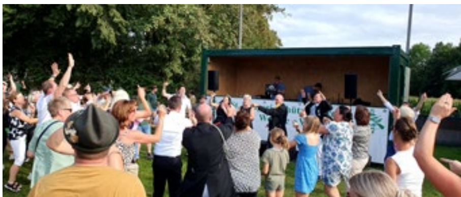
Ausgelassene Stimmung am "neuen Dienstag". Auf den abendlichen Thronball wurde erstmals verzichtet, dafür feierte man den ganzen Tag über bei schönstem Wetter auf dem Schützenplatz, musikalisch begleitet vom Musikverein und später von einem DJ.

Der Schützenfestdienstag hatte einige Neuerungen zu bieten. Während die Schützen traditionell zur Parade auf der Hauptstraße weilten, nahmen mehr als 200 Frauen am erstmals angebotenen Frauenfrühstück teil. Das anschließende Fröhschoppenkonzert wechselte nach dem Mittag nach draußen auf den Festplatz an der Vogelstange. Der Musikverein Weseke gab auch am vierten Schützenfesttag nochmal alles. Bei bester Stimmung wurde mit Tanz und Polonaise, später mit Musik vom DJ bis in die Nacht ausgelassen unter dem Fall-